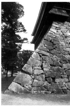
出典：平野隆彰「穴太の石積み」 穴太衆積み研究 電話：〇七七・五七八・〇一七〇