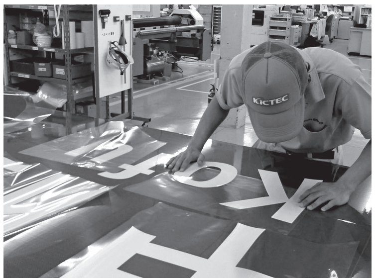
写真1 文字フィルムの貼り付け

アルミ板の上に各標識のフィルムを真空加熱圧着させて製造しますが、案内標識とその他の標識では製造方