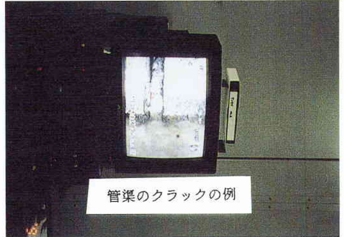
写真5 テレビカメラによる下水管渠の調査