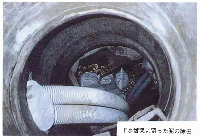
下水管渠に留った泥の除去