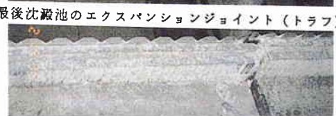
写真1 東灘処理場の損傷状況