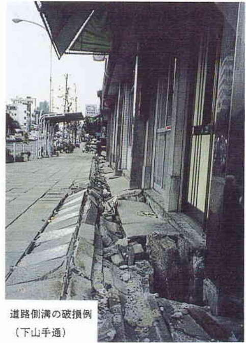
道路側溝の破損例 (下山手通)