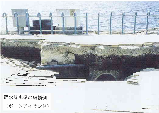
雨水排水渠の破損例 (ポートアイランド)