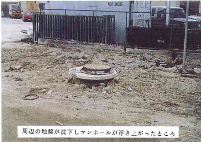
周辺の地盤が沈下しマンホールが浮き上がったところ