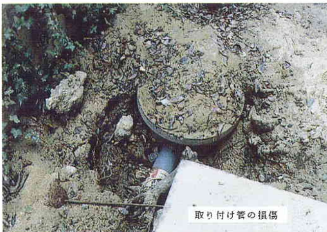
取り付け管の損傷