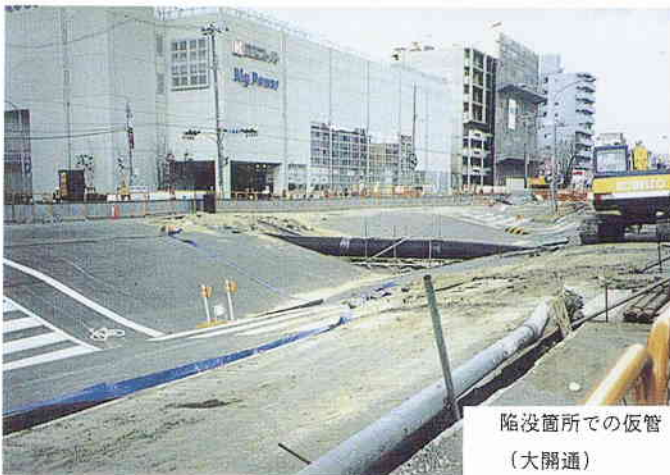
陥没箇所での仮管 (大開通)