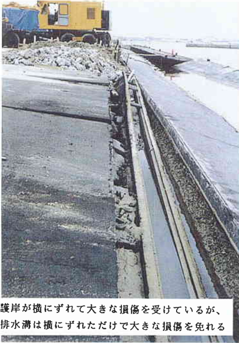
護岸が横にずれて大きな損傷を受けているが、排水溝は横にずれただけで大きな損傷を免れる