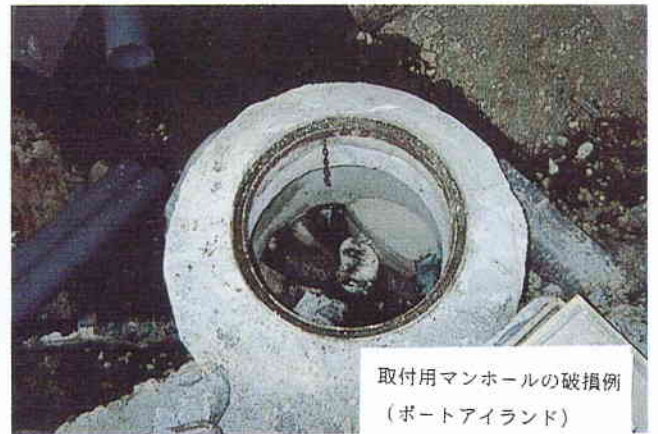
取付用マンホールの破損例 (ポートアイランド)