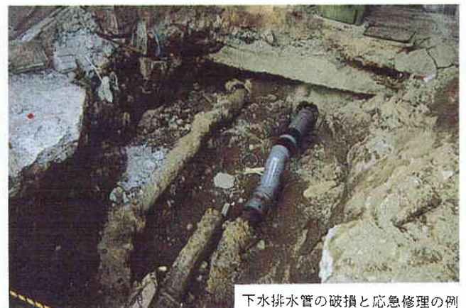
下水排水管の破損と応急修理の例 (ポートアイランド)