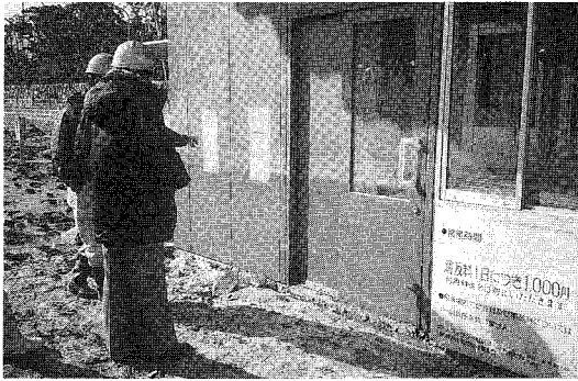
写真-1 料金所に残る泥水跡