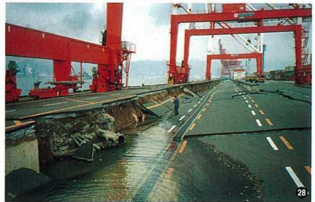
〈コンテナバース・神戸市ポートアイランド〉