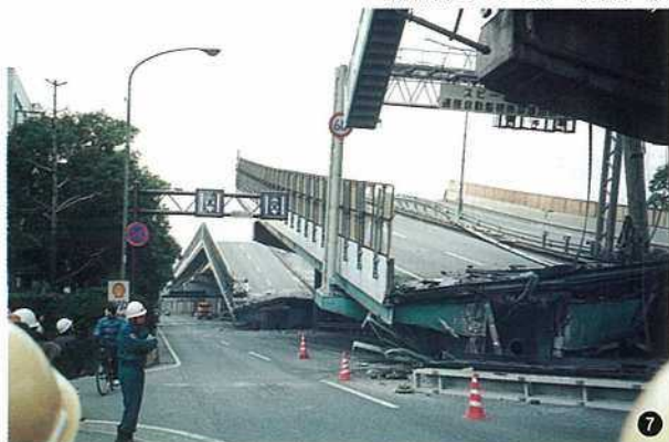
〈阪神高速道路3号神戸線・西宮市西宮戒神社付近〉