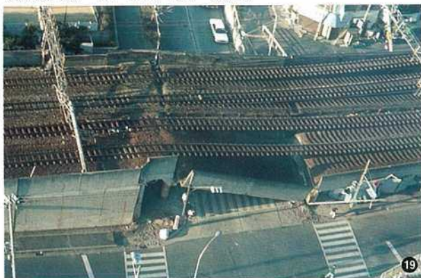
〈東海道線・神戸市六甲道～灘間〉