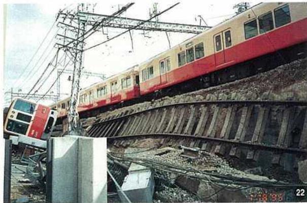
〈阪神電鉄・神戸市東灘区御影留置線〉