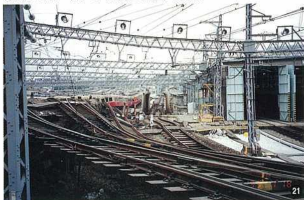
〈阪神電鉄・神戸市東灘区石屋川車庫〉