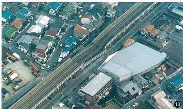
〈山陽新幹線・伊丹市野間〉