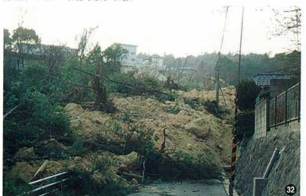
〈地すべり・西宮市仁川〉