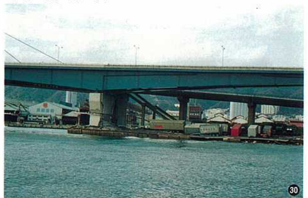
〈摩耶大橋・神戸市〉