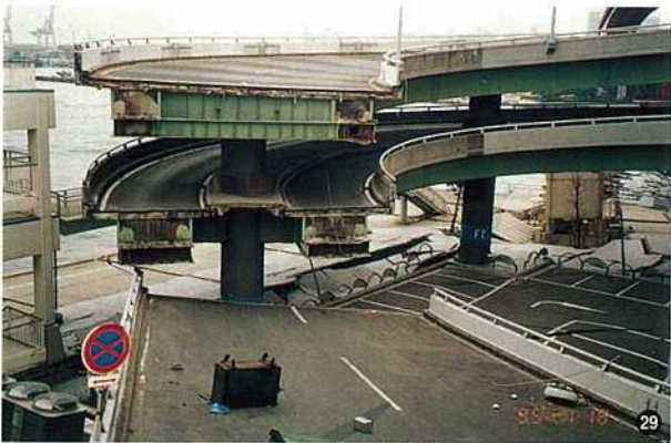
〈神戸大橋ポートターミナル取付部・神戸市〉