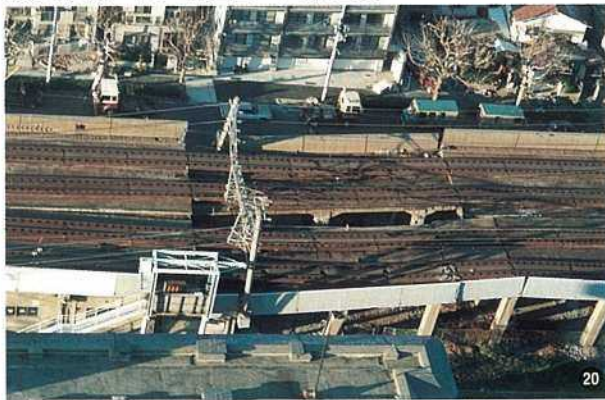
〈東海道線・神戸市住吉～六甲道間〉