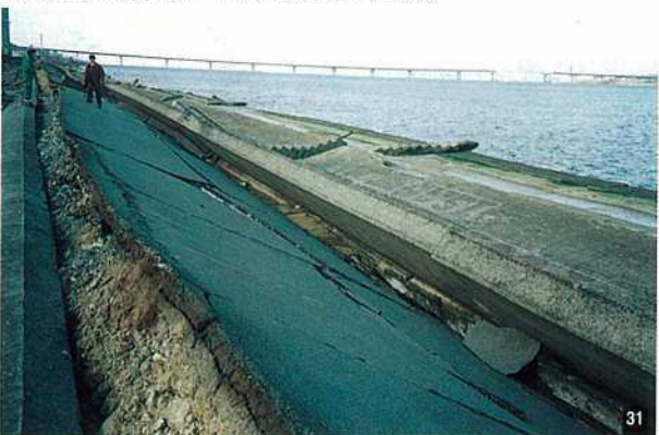
〈新淀川河口附近・大阪市此花区西島〉