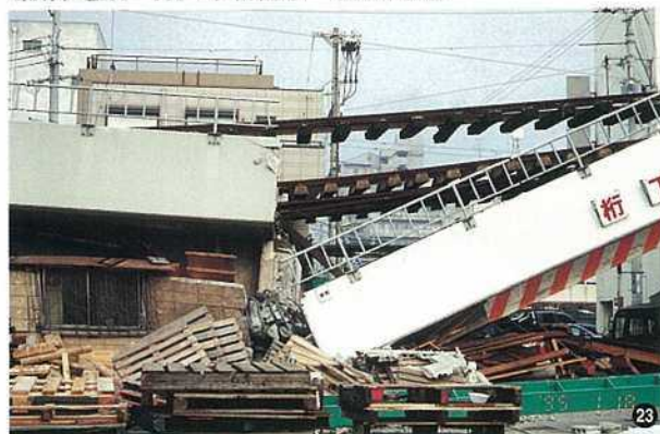
〈阪神電鉄・神戸市新在家～石屋川間〉