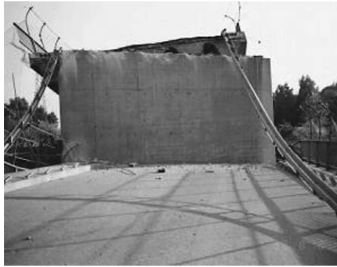
写真-2 トルコ・コジャエリ地震での高架道路