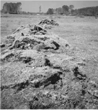
写真-1 トルコ・コジャエリ地震の断層