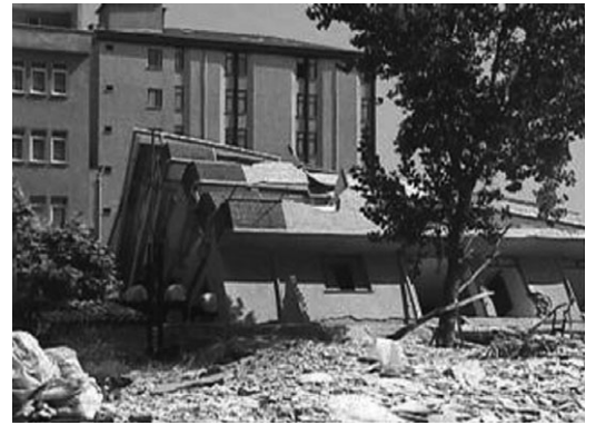
写真-3 Istanbul (Avclar) での被害

布されていないという悔しさがある。トルコの民間テレビや国営放送のテレビ・ラジオ等でも地震火災に際して、日本のように自動的に震度情報などが放送機関に流れるというシステムはトルコにはいまだ整っていない。