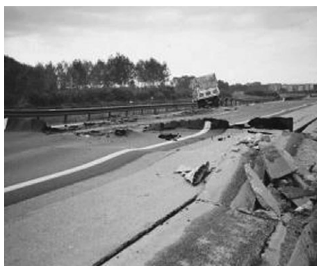
写真-5 トルコ・コジャエリ地震で破壊された高速道路