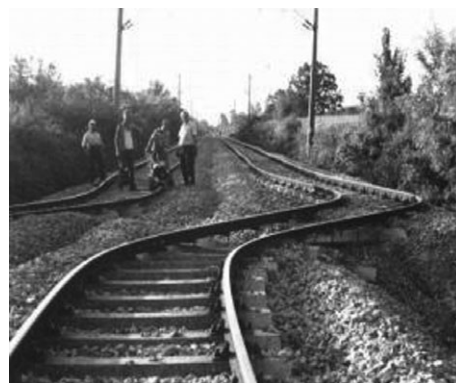
写真-6 地殻変動で湾曲した線路

にも大打撃を与え、特に地震の震源地であったコジャエリは、トルコ北西部の重工業と金融機関が集中する経済の心臓部であったから民間部門の損害も GNP 国民総生産に対し 80 % に達し 2 兆 2 千億円の被害に上った。今後、トルコのこの地震帯には繰り返し地震が発生するであろうと予想される。被害対策の確立がトルコにとっての急務である(図-2)。