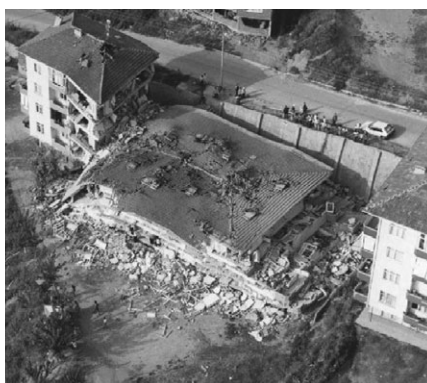
写真-4 バンケーキ破壊