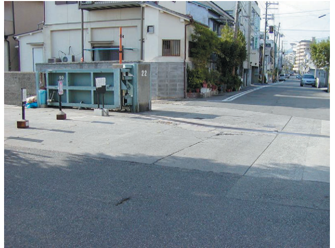
写真-2 臨海地域の鉄扉（南海地震津波が来襲する臨海都市域では大小の水門、鉄扉、陸閘が数千基存在している。強い地震動で破損したり、閉じる作業が間に合わない場合は津波氾濫が起こる。）

ところが、大阪の場合、ゼロメートル地帯が臨海部を中心に広範囲に分布している。もし最悪を仮定すると上町台地以外はすべて水没しかねない。しかし、政府の被害想定では、