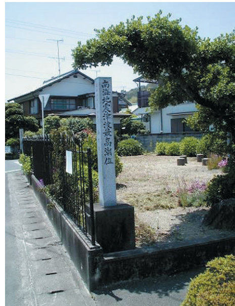
写真-3 徳島県海南町浅川の南海地震津波の浸水深表示(浅川地区に設けられた昭和南海地震津波の浸水深を示す石柱の写真。住民は普段から津波の脅威を身近に感じて生活している。)

津波災害についての研究の目標は、被害を軽減することであるから、それにつながる研究が重要であろう。人的被害を軽減するためには、地震直後にすぐに自主避難することである。自主避難するには、事前に津波の危険性を正確に理解し