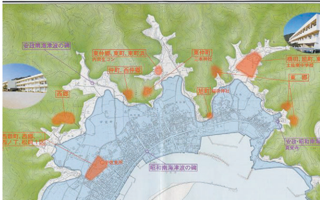
図-3 高知県土佐市宇佐地区津波避難マップ（避難所と津波モニュメントを併記した津波氾濫図。この地域は過去の南海地震津波で大きな被害を受けている。津波ハザードマップはこれを基礎にして作られる。）