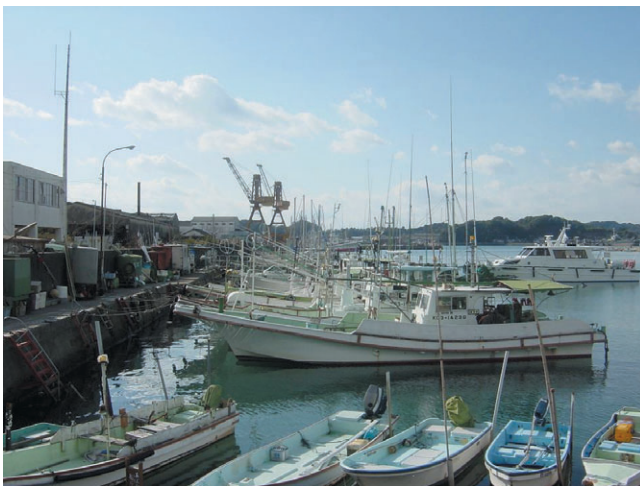
写真-1 浦戸湾の沈下と漁船（南海地震が発生すると高知市の沿岸部では地震と同時に約1.5m地盤沈下する。そこに津波が来襲する。水門や鉄扉も被災し、浸水が発生すると予想される。）

2002年7月、巨大地震に備えるための「東南海・南海地震に係る地震防災対策の推進に関する特別措置法」が成立した。法によると、両地震で大きな被害を受ける恐れのある地