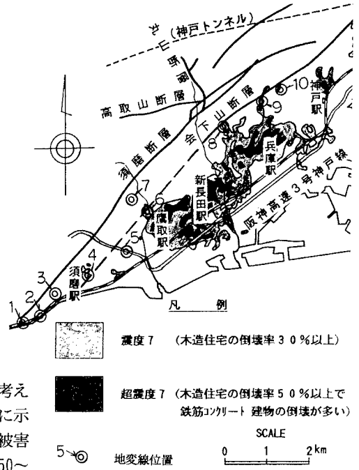
図-1 地変線と震度マップ

神戸西部地域で確認した兵庫県南部地震による地変線は、須磨断層・会下山断層の南側に位置し、顕著な被害が線状に配列するなど地震断層による地表変位とも考えられた。しかし、今回確認した地変線の幾つかは図-2に示すように溜め池や谷部を盛土した箇所でもあり、顕著な被害は地盤構成にも左右されている。また、各々の地変線は50～100mの延長が確認できるが、地表の変位は微小で、変位のセンスも複雑である。これより、これら地変線は地震断層による地表変位とは判断できず、岩盤深部での変形が地表部では分散し、地盤構成も影響して間接的に各種の災害現象として現われたと考えられる。