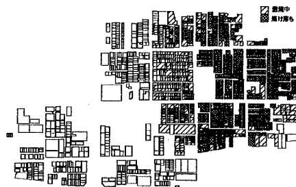
図2 延焼シミュレーション結果