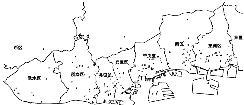
図-3 突き上げるような揺れの証言分布（神戸市）

新聞・刊行物より採集した激震地の多くの人達が感じた本震前の「ドンと突き上げるような揺れ」や「物体の飛び跳ね」事例から推測すれば、今回の地震では記録されていない衝撃的上下地動があったように思われる。