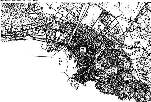
図-1 釧路市の表層地質構造を考慮した地域図

釧路市内の釧路沖地震および北海道東方沖地震による震度は両地震とも釧路市内中央部釧路川から東へ旧釧路川方面への低地沖積層および高地とその境界付近で震度が高くなっている。震度の高い地域の被害が大きいわけであるが、まず地質、地形の違いにより図-1に示すような7地域に分けて進めることにする。A・B・C・D地域は旧釧路川の東部の高地で洪積世の釧路層群、E・F・G地域は海岸沖積世地である。