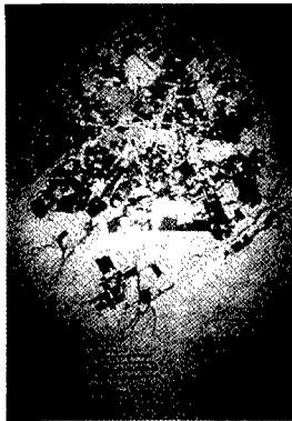
<図3> Tashkent 市構造物分布