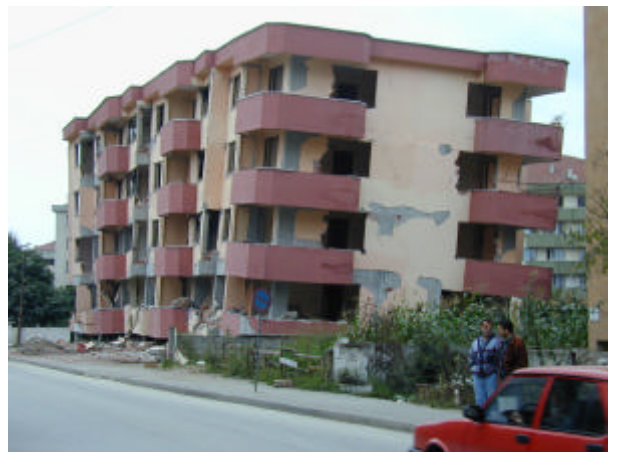
写真 - 4 Duzceのアパート倒壊