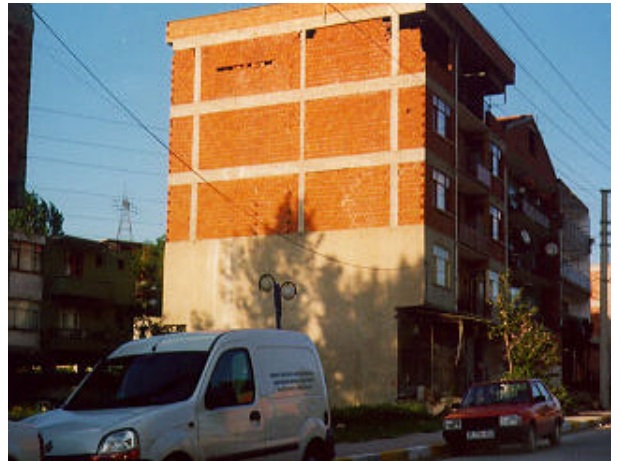
写真 - 1 Kocaeli北部郊外の煉瓦造建物の被害

地震被害の境界に相当するSakarya分岐点の北、Kocaeliの北域、ならびにKaramurselの南のKaraahmetliは、断層最短距離約20kmに位置しており、丘陵地に位置しているため、地震動増幅の影響は比較的少ないと考えられ、これらの地点における最大加速度の目安値は、図 - 2 より150gal程度と想定できる。