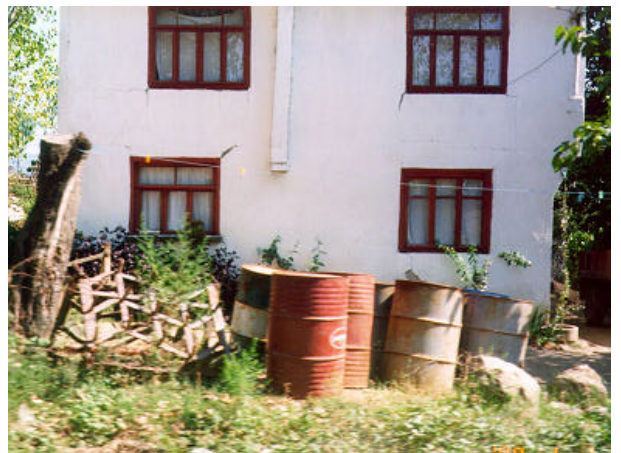
写真 - 2 Karaahmetliにおける民家の亀裂

Sakaryaからその北の分岐点、ならびにKarasuに至る約50kmの区間の道路は、河川の後背湿地と谷間を通過する路線であり、所々で民家に被害が発生している。とくに黒海に面した町Karasuでは、写真 - 3のようにアパートの倒壊が発生しており、聞き取り調査によれば住民も激しい地震動を体験している。一方、東では、断層破壊の端部とされているDuzceにおいて、多数の建物が崩壊した(写真 - 4)。Duzce郊外には、大きな河川が流れており、水害によっていくつもの橋梁が流された形跡がある。Duzceはこの河川によって供給された沖積地盤上に形成された町と考えられ、断層破壊が近くで発生したのみならず、地震動の増幅が大きかったことが推測される。