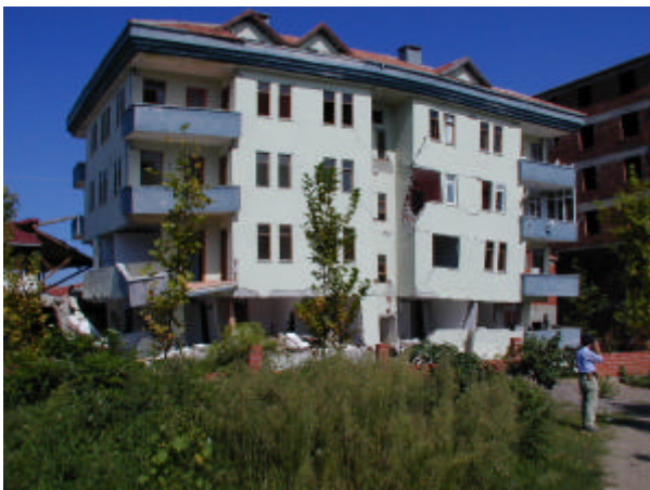
写真 - 3 Karasuのアパート被害