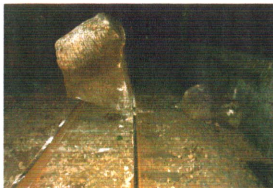
写真-2 落石による被害