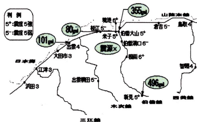
図-1 各地の震度分布とガル値

表-1 に被害箇所の一覧を、図-2 に被害箇所の分布を示す。伯備線は 1 級河川日野川に沿って走り、その殆どが土工設備であることから、土工関係の災害が大半を占めており、黒坂～根雨間を中心とした山間部に集中した。根雨～武庫間では、地震以後の余震により沢地形斜面の集水部が緩み、表面の不安定部分が 10 月 8 日に時間を置いて崩壊し、約 400m 3 の土砂が線路へ流入するとともに、並行する国道までを覆った。（写真-1）生山～上菅間では、左側斜面から径 4 m もの岩石が落下し、線路を損傷して右側に平行した国道を飛び越え、河川内へ落下した。落石（写真-2）の発生箇所には、落石止め柵等の対策工が有効に働き、線路までは到達しなかったものも多数見られる。橋梁については、橋脚周面上の水平ひび割れの発生および翼壁の崩壊に伴う橋台裏の道床流出が主な被害である。中には表面コンクリートの部分剥離を伴ったものもある。