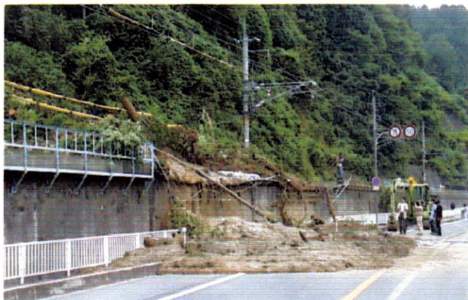
写真-1 時間差で発生した土砂流入状況