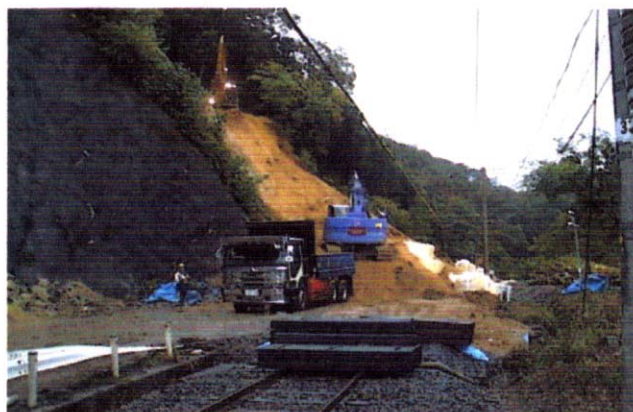
写真-3 斜面の再崩壊(根妻付近)

10月28日、黒坂・根雨間の斜面崩壊現場において、復旧工事施工中に余震が原因と思われる斜面の再崩壊が発生し、 200\text{m}^3 を超える土砂が線路に流入したため、生山～根雨間が再度不通となった(写真-3)。そこで、更なる崩壊を食い止めるため、JR鉄道総研の指導を得て、周辺踏査により斜面の変状を調査した結果、崩壊斜面の直上部に土砂崩壊の兆候を示すクラックの存在を確認した。また、この地域は花崗岩を主とした地質であるが、表層部は風化の進行で真砂土に近く破碎している状況であるため、さらなる崩壊が懸念された。そこで、崩壊斜面とその上部斜面の2箇所ボーリング調査を実施し、クラックに起因して想定される再崩壊について検討を実施した。その結果、地質状態が不安定な表層付近の土塊を含み、復旧施工として広範囲な切土を実施することとした。切土範囲は延長90m、標高差60m、切土量は約 16,000\text{m}^3 に達した。また、H型钢による土留柵(L=90m、H=6m)を線路と平行に設置することとした(写真-4)。切土施工は、膨大な土砂の搬出ルート確保や土中の岩塊撤去等により困難を極めたが、延べ21日間に亘る昼夜施工の結果、11月17日に運転を再開することができた。