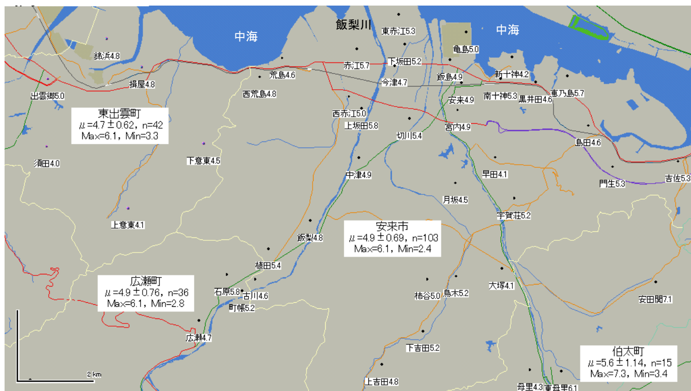
図 3 島根県内震央付近の安来市、東出雲町、伯太町、広瀬町における町域別アンケート震度分布