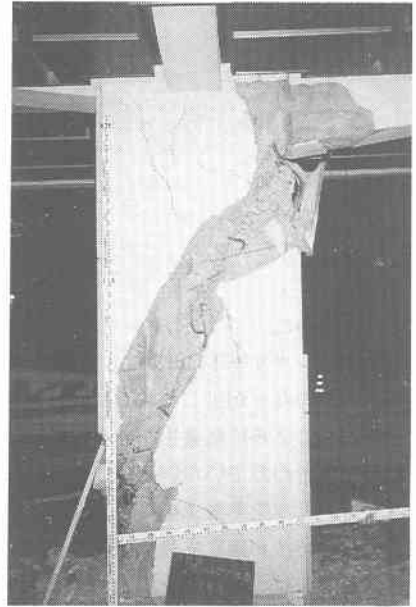
写真-7 学校校舎のRC柱と壁がせん断破壊を起こしスターラフが破断し、軸方向鉄筋が変形し降伏(昭和38年築,3階建ての1階部分)