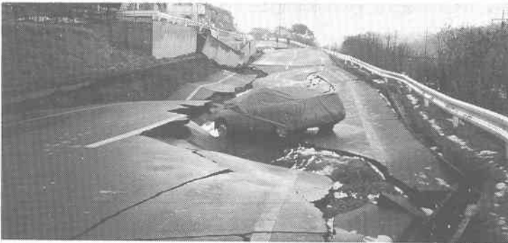
写真-8 道路の盛り土と路盤の崩壊に伴うI字型コンクリート擁壁が3.5m迫り出しと2.5m沈下(八戸市松が丘)

3.2 防災対策の考察 増設や増築等をする時、旧設と新設の構築部分で揺れが異なり、衝突等が生じて被害招くことがあるため、地震の際の衝突を避ける等の考慮を要する。