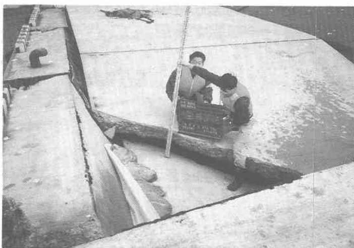
写真-5 防潮堤の基礎付近のコンクリートのひびわれ及び壁にせん断ひびわれ(漁港,花咲)