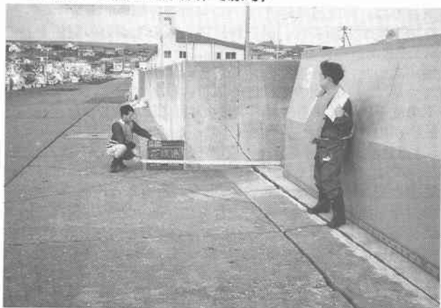
写真-4 岸壁が傾きコンクリート版エプロンが沈下破断(漁港岸壁・エプロン,歯舞)