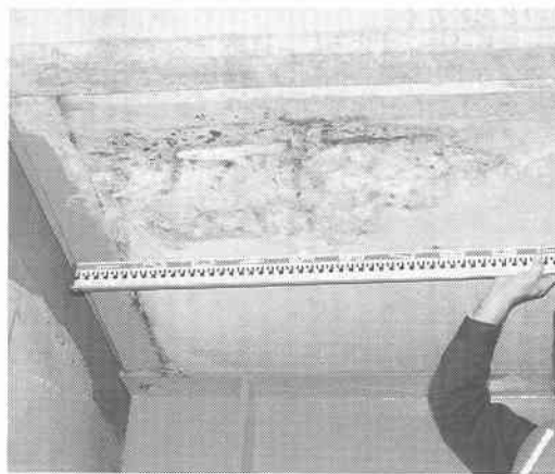
写真-2 桁端部がアハットに衝突し端部のコンクリートが破損剥落しスターラップ等の鉄筋が露出(合成桁道路橋、別海町風連)