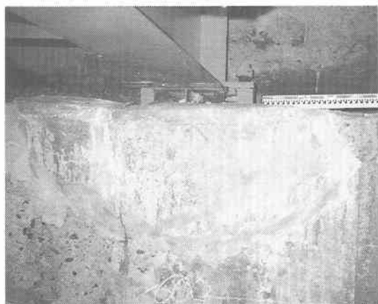
写真-1 支承部のアハットの破損と定着している橋台のコンクリートのめくれ上がり(合成桁道路橋、別海町万年)

*2: 八戸市の集計(95年1月初旬集計,水道の耐震管切り替え費用306億円含む)