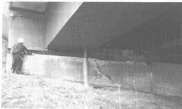
写真-3 沓座のボルトの破断と橋台の支承部コンクリートの上部2m75cm下部4m60cmの幅の亀裂とめくれ上がり(道路橋,3径間連続,2主鋼桁ボックス断面橋中標津町緑町)

写真-8に示すように、道路の盛り土と路盤の崩壊(八戸市松が丘)に伴うL字型コンクリート擁壁が3.5m迫り出しと2.5m沈下した。