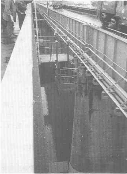
写真-6 鋼橋の橋脚が上流側に約20cm程度傾き道路橋と歩道橋の橋脚の上端部コンクリートが損傷(道路橋:昭和6年建設,歩道橋:昭和47年増設,八戸市売市熊野堂-長苗代内舟渡)