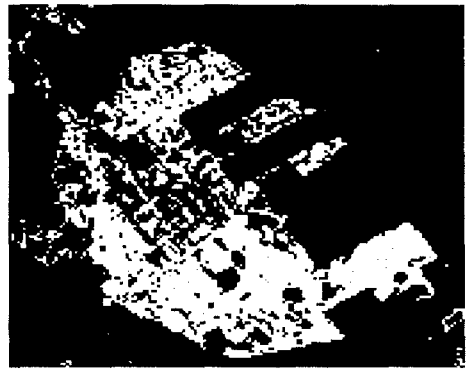
図4 地震後の土地被覆成分