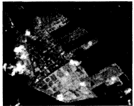
図1 トゥルーカラー画像

本研究で使用した衛星データはLANDSAT5号TMデータであり、地震前の冬季に撮影された雲量の比較的少ない1993年3月23日 (path=110, row=036) の画像と、同一地域で地震直後に撮影された1995年1月24日の2時期の画像を利用した。本文では、特に液状化の程度が激しかったポートアイランドに注目して検討を行う。図1はバンド1~3を合成した地震後のポートアイランドのトゥルーカラー画像 (160×140画素) であり、液状化による噴砂で茶褐色に染まった領域が目視判読可能である。