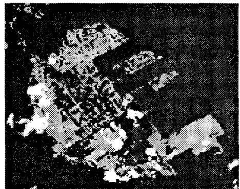
図5 地震前後の差画像