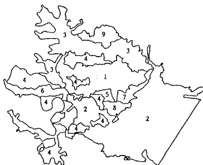
図1 水系の大ブロック図

また、上水道間・各配水所間で相互融通できるように配水管網を整備を行っている。例えば、仙台共同溝、中央配水幹線網などである。