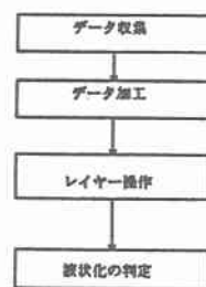
図2 液状化簡易判定システムの構築