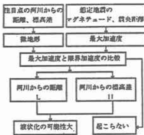
図1 液状化発生簡易判定法のフロー