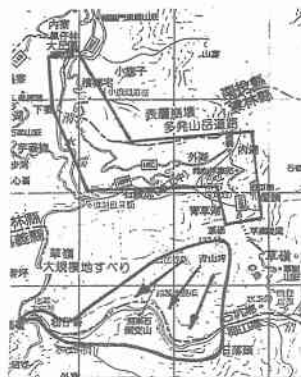
図一三 雲林縣草嶺の大規模地すべりと表層崩壊多発山岳道路位置図

草嶺の大規模地すべりは、震央から南南西約 30 km、南投縣竹山の南方 20 km のところに位置する雲林縣草嶺で発生した。地すべりの規模は草嶺山頂（標高 1234m）から斜面下の清水溪（標高 400~500m）まで一気に崩壊し、清水溪を約 4 km にわたって土砂で埋め立て、さらに対岸に乗り上げてから、なおも斜面を這い上って小さな尾根を乗り越えている（図一三、写真一三）。崩壊面積 7 km 2 、崩壊土量 1 億 8 千万 m 3 に達するもので、今回台湾地震の最大規模の地すべりである。この草嶺では以前にも崩壊が発生しており、今回それが拡大して発生したと見られる。