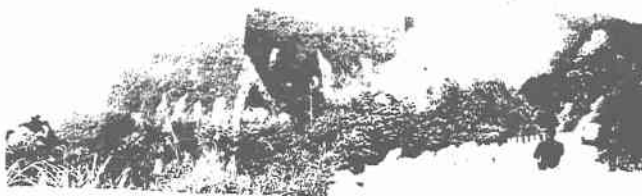
写真二 雲林縣草嶺へ向かう山岳道路での表層崩壊