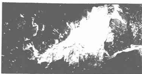
写真一三 草嶺の大規模地すべり

育はあまり良いものではない。このように、表層崩壊は、斜面勾配が大きく、風化層がある程度分布し、植生の生育もそれほどしっかりしたものでないことなどを素因として、地震動により崩れやすいところから崩壊したと考えられる。また、台地部の断層近傍の河岸段丘では、地震動の解放側にあたる河岸頂部の切り立った急斜面において表層崩壊が発生していた。