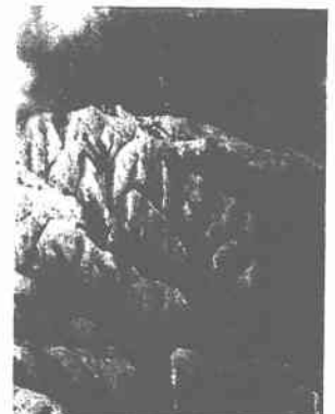
写真一 九九峰の崩壊による裸地状況