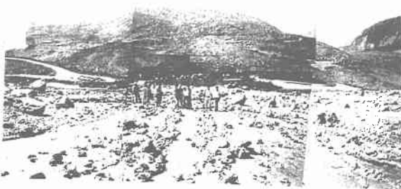
写真一四 中腹から見た草嶺大規模地すべりの末端状況

5. 終わりに 今回、台湾集集地震発生後、現地調査を行った結果、斜面被害はかなり大規模であり、予想を上回る実態が確認された。日本は台湾に負けないくらい急峻な地形であり、地質構造も複雑で活断層も数多く存在する。日本で台湾のような斜面被害が発生すると、想像もつかないような被害が発生するに違いない。今後は急斜地斜面での表層崩壊や大規模地すべりなどについて、その発生の原因を究明するとともに地震動との関係を明らかにし、日本への適用や応用を検討する必要がある。日本での対策については財政難の経済状態を考えると、ハードとソフト両面からの対策が必要である。