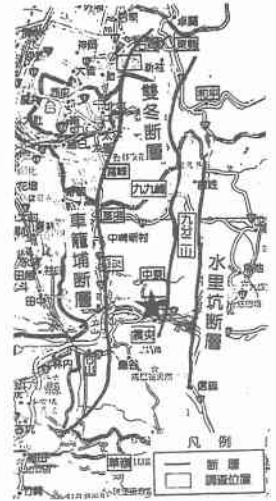
図一 台湾 9.21 集集地震位置図

表層崩壊は南投縣竹山から雲林縣草嶺へ向かう山岳道路で詳しく観察することができた (図一)。写真二は尾根部近傍からみた、沢を隔てた斜面崩壊である。右側に崩壊面積が大きい部分が認められるとともに、左側の斜面も大部分が崩壊している様子で、崩壊の割合が高い。地質は第三紀層で、ほぼ平行な層理が遠くからも確認され、ほとんどが岩盤斜面と推定される。植生も崩壊以前は緑で覆われていたと思われるが、植生の生