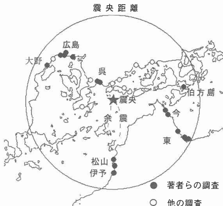
図-1 液状化地点の分布

図-2にいくつかの噴砂の粒径加積曲線(n=13)を示す。太線で示したものが重信川の噴砂であり、その他は全て埋立地の噴砂である。これらはいずれも埋立地の噴砂である。この図の中では松山空港の噴砂が最も