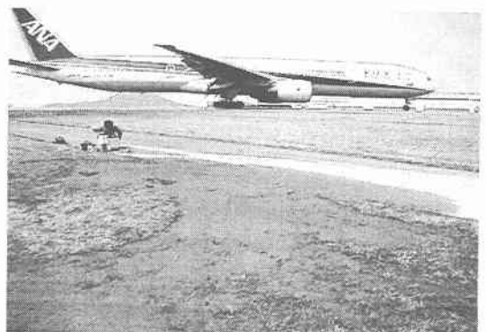
写真-1 松山空港の液状化