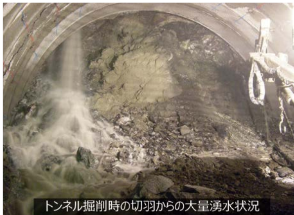
トンネル掘削時の切羽からの大量湧水状況