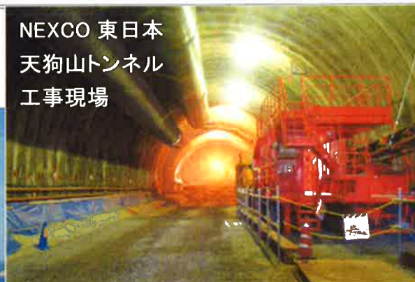
NEXCO 東日本 天狗山トンネル 工事現場