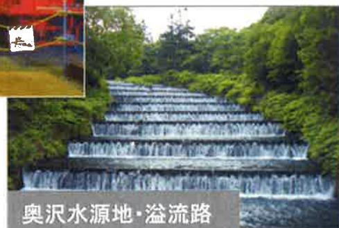
奥沢水源地・溢流路