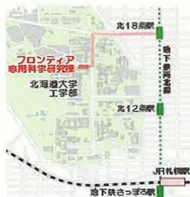
地下鉄南北線 北18条駅2番出口から徒歩10分