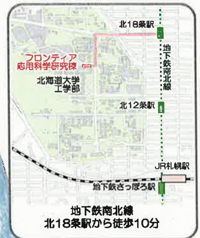
地下鉄南北線 北18条駅から徒歩10分