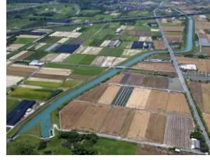
嘉南大圳 /嘉南平野の1500km 2 を潤す水路は延長1600kmもの長さです