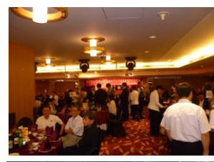
墓前祭後の歓迎会 /墓前祭の後、嘉南農田水利会の方々との交流・懇親を深めます