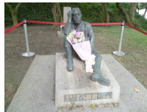
八田與一像 /戦火や弾圧から守られた八田與一像はダム湖のほとりにあります