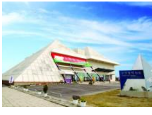
台湾塩博物館 /かつての塩田の作業風景や製塩の様子が展示されています