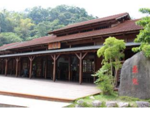
車埕火車站 /日本統治時代に、台湾電力の水力発電所の建設資材の輸送のために敷設された全長29.7kmの集集線の終点駅。