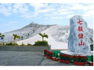
七股鹽山 /かつて台湾最大の塩田だった七股鹽山は有名な観光スポットになっています