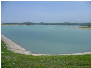
珊瑚潭 /烏山頭ダム湖はその美しさから珊瑚潭とも言われています