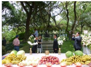
墓前祭 /八田與一は没後地元の方々によって毎年墓前祭が開催されています