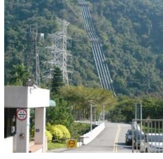
大観発電所 /日月潭から引かれた水はここで発電され、台湾の水力発電の半分以上を担っています