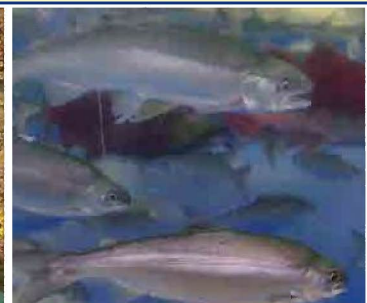
千歳さけますの森さけます情報館