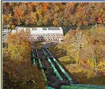
千歳川第一発電所 (土木学会選奨土木遺産)

大正4年創業の支笏湖湖畔に建つ老舗旅館。支笏湖名物の姫鱒を、シンプルに塩焼で食べる姫鱒姿焼き定食をご用意!