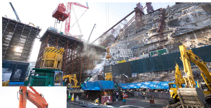
(写真:最盛期を迎えるダム本体建設工事)