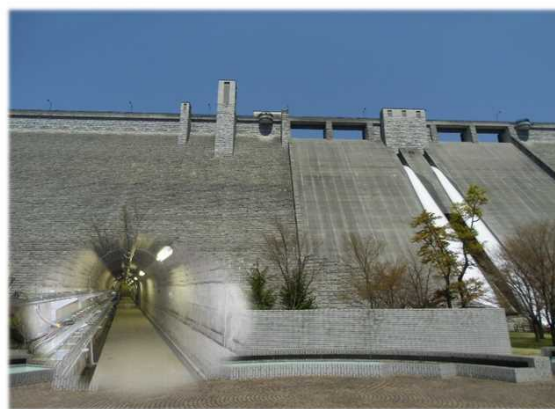
(写真)完成している四万川ダム本体内部を見学できます