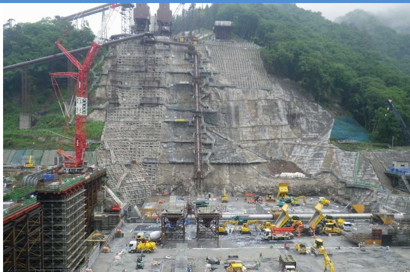
(写真:ハッ場ダム 本体工事状況)

「ハッ場ダム」は、首都圏で唯一の建設中のダムで、本県長野原町で建設が進められています。ダム本体の建設工事が現在、ピークを迎えており、日本で開発された最先端のダム建設技術で建設が進められています。群馬県内では、平成14年完成の大仁田ダム以後、15年ぶりとなるダム本体建設の様子を間近で見ることができる貴重な機会となります。さらに「四万川ダム(平成11年完成)」ではダム本体内部に入って見学していただきます。是非、「水源県“群馬”」を築く土木施設に直接触れて下さい。